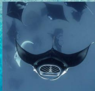
Manta Ray Snorkeling