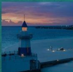
Light House Restaurant