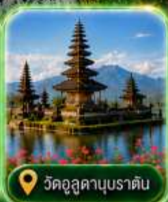
วัดอูลูดานูบราตัน