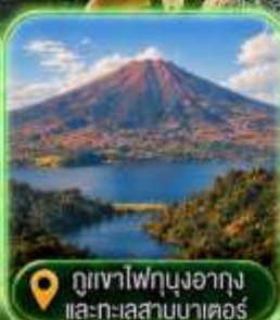
ภูเขาไฟบุงอากุง และทะเลสาบมาตอร์