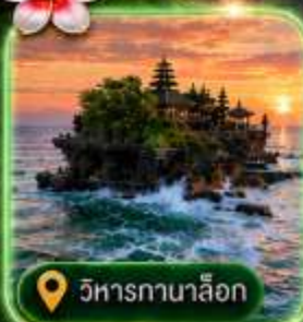
วิหารกานาล็อก