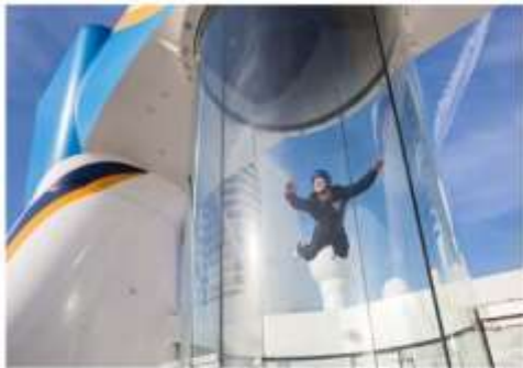
RIPCORD® BY IFLY®