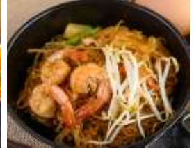
CHAR HWAY TEOW

หรือท่านสามารถซื้อทัวร์เสริมของทางเรือ (ก่อนถึงปีนัง 1 วัน ที่เคาน์เตอร์ขายทัวร์เสริมบนเรือ) เจ้าหน้าที่จะทำการนัดหมายในการลงเรือกับท่านในวันรุ่งขึ้น