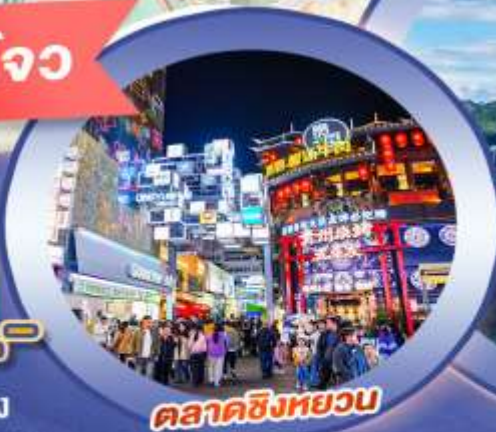
ตลาดซิงหยวน