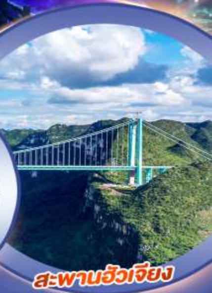
สะพานฮัวเจียง