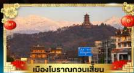
เมืองโบราณกวนเสียน