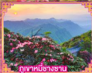
ภูเขาหมีช้างซาน