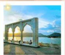
Ana Sagar Lake