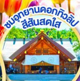
ชมอุทยานดอกทิวลิป สีแสนสดใส