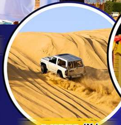
รถเช่าราย 4X4

เริ่มต้น 10ท่าน คอนเฟิร์มเดินทาง 37,988.- มกราคม - พฤษภาคม 69