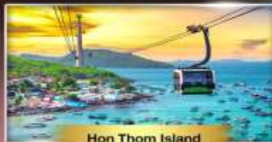
Hon Thom Island