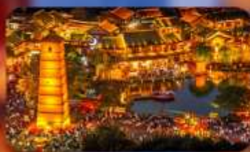
เมืองโบราณลั่วยี่