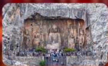
ถ้ำผาหลงเหมิน