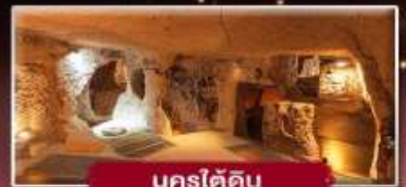
นครใต้ดิน