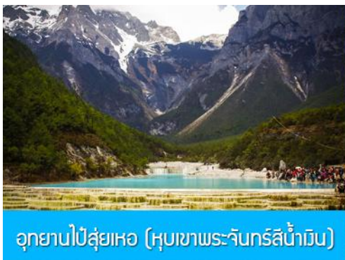
อุทยานปี่สุ่ยเหอ (หุบเขาพระจันทร์สีน้ำเงิน)

หมายเหตุ กรณีที่กระเช้าใหญ่ขึ้นภูเขาหิมะมังกรหยกปิดให้บริการ ด้วยเหตุที่สภาพอากาศไม่เอื้ออำนวย หรือเป็นการปิดเพื่อตรวจสอบสภาพและซ่อมแซมประจำปี ทางทัวร์ขอสงวนสิทธิ์ที่จะจัดโปรแกรมขึ้นกระเช้า ที่จุดชมวิวภูเขาหิมะมังกรหยก ณ สถานีกระเช้าหุยนซานผิง แทน