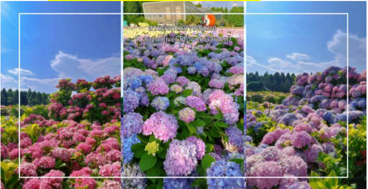
สวนดอกไม้ลาวยูเนอ (Laoyu River Flower Garden)

หมายเหตุ : การออกดอกของดอกไม้ในโปรแกรมท่องเที่ยวอาจแตกต่างกันไปในแต่ละช่วงเวลา ทั้งนี้ขึ้นอยู่กับสภาพอากาศและสภาพภูมิประเทศของพื้นที่ ณ วันเดินทางจริง ดอกไม้อาจยังไม่บานเต็มที่หรืออาจร่วงโรยแล้วทางบริษัทฯ ไม่สามารถการันตีการออกดอกหรือความสวยงามของดอกไม้ได้