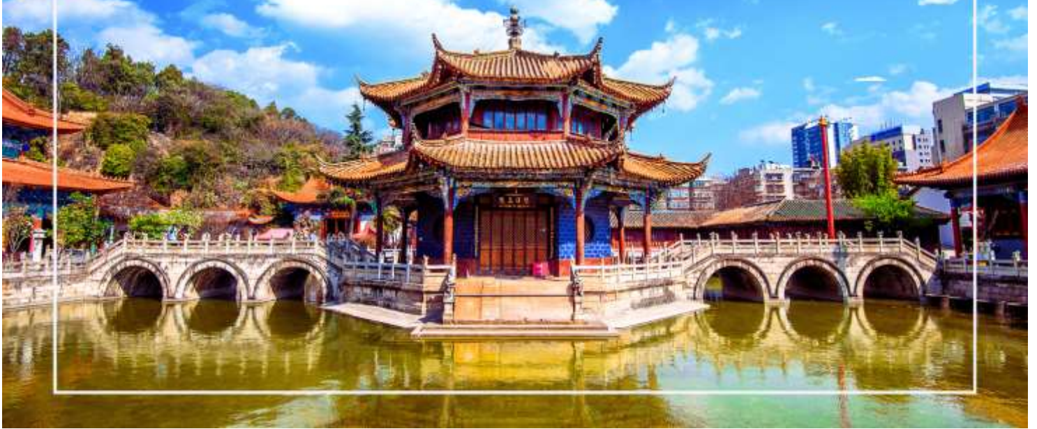
วัดหยวนตง (Yuantong Temple)