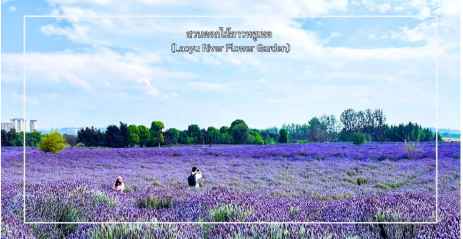
สวนดอกไม้ลาวพวยแพ (Laoyu River Flower Garden)