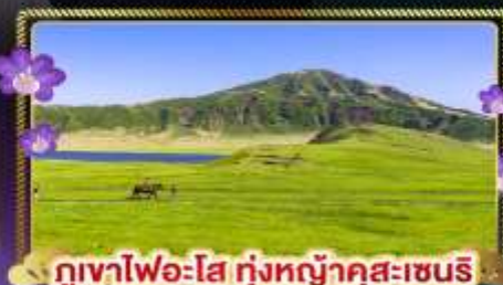
ทะเลสาบอะโฮะ ทุ่งหญ้าคุสะเซเนริ