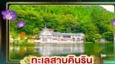
ทะเลสาบคินริน