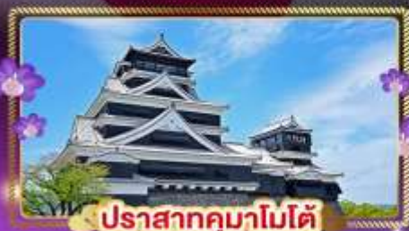
ปราสาทคุมาโมโตะ