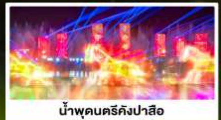
น้ำพุดนครคังปาสือ