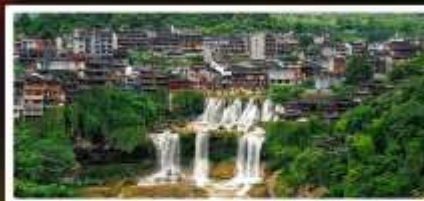
หมู่บ้านฟุทงเจิน