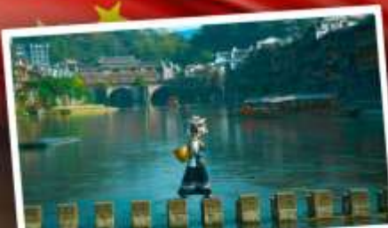
หมู่บ้านเฟิ่งทง

สุดคุ้ม!! พัก 5 ดาว ทุกคืน มนตร์เสน่ห์เมืองเก่า ริมสาងน้ำแจ่มใสแดน