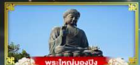
พระใหญ่ของปิง