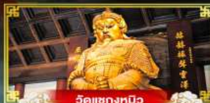
วัดเซ่งเตี๊ยะ