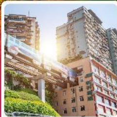
รถไฟฟ้ากะลุ่ตึก