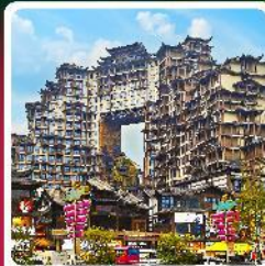
ตึกหัตถกรรม 72