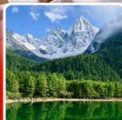
อุทยานปี้เฟิงโกว