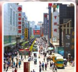
ช้อปปิ้งถนนคนเดินซุนซีลู่