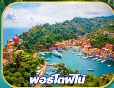
พอร์ตอฟีโน