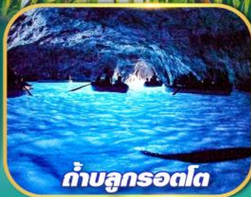
ถ้ำบลูกรอตโต