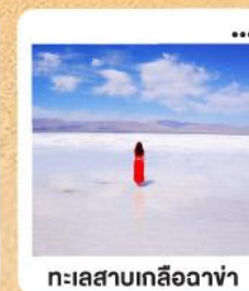
ทะเลสาบเกลือฉาซ่า