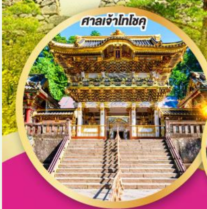
ศาลเจ้าโทโฮกุ