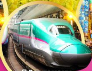
รถไฟ JR TOHOKU SHINKANSEN LINE