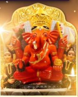
องค์สิทธินายิก