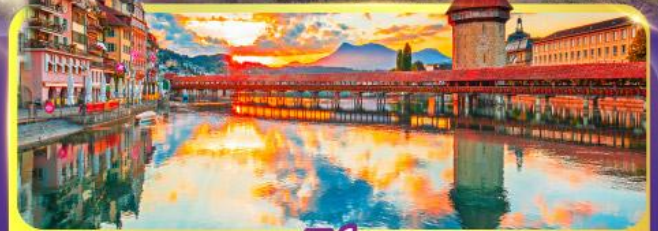
ลูซิิร์น

GO3MXP-SQ002 • ซ็อบปิ้ง Serravalle Outlet