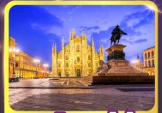
มหาวิหารคูโอโม