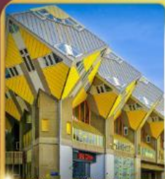
บ้านลูกเต่า โคร็กคูมูส

“ล่องเรือหลังคากระจก” ชมกรุงอัมสเตอร์ดัม