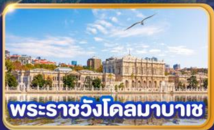
พระราชวังโคลมาบาซ