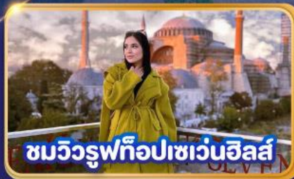
ชมวิวยุฟทือปเซเวนฮิลส์