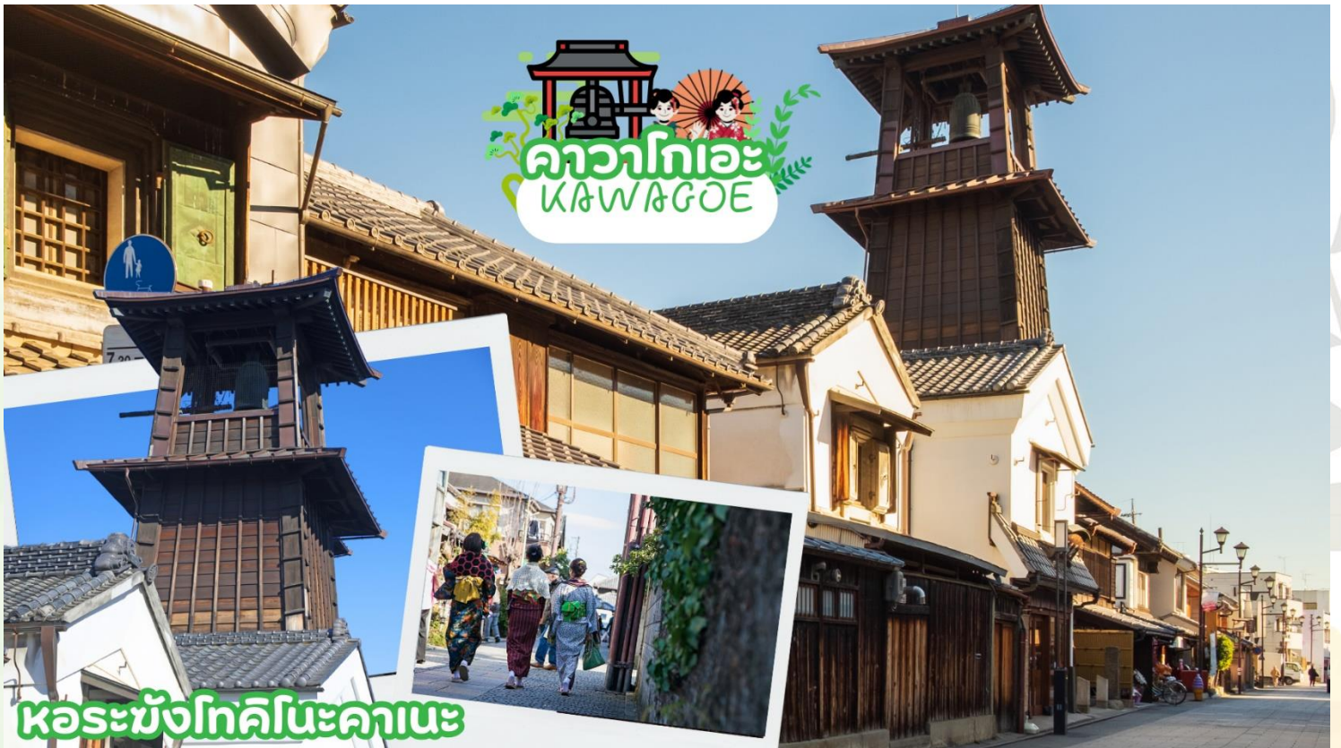
หอระฆังโกลิโนะคานะ