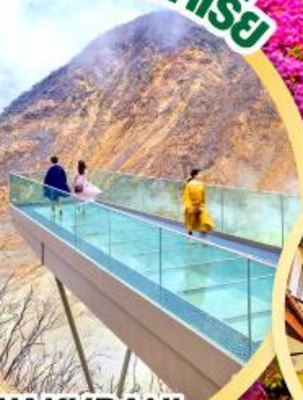
OWAKUDANI EARTH VALLEY