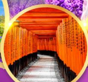
ศาลเจ้าฟุชิมิอินาริ