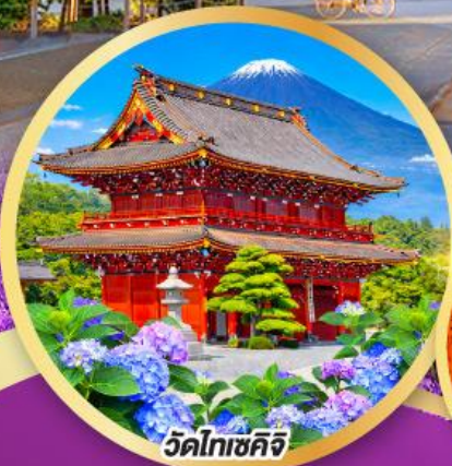
วัดโทเซคิจิ