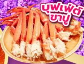
บุฟเฟ่ต์ ซาบู