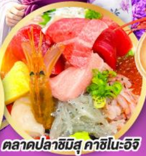
ตลาดปลาซิมิสึ คาชิโนะอิจิ