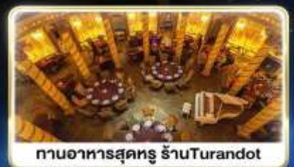
ทานอาหารสุดหรู ร้านอาหารTurandot