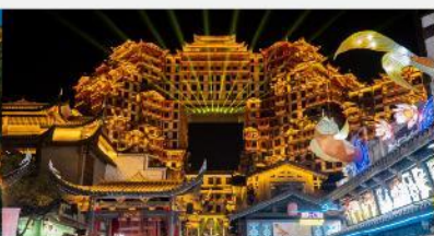
ตีทมห้ศจสรย์ 72