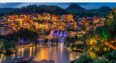
หมู่บ้านโบราณฝูหรงเจิน