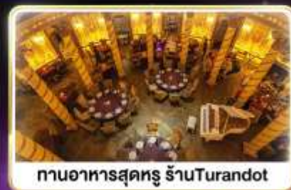
กานอาหารสุดหรู ร้านTurandot