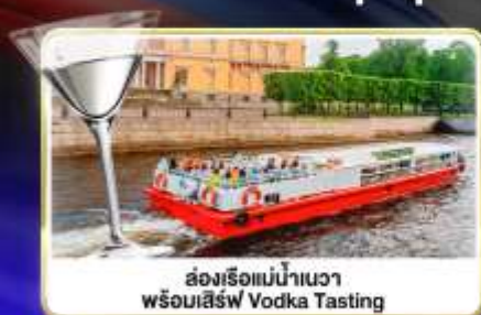
ล่องเรือแม่น้ำแคว พร้อมเสิร์ฟ Vodka Tasting