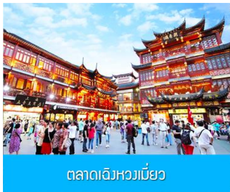
ตลาดเจิงหวงเมี่ยว

เช้า รับประทานอาหารเช้า ณ ห้องอาหารของโรงแรม (6)