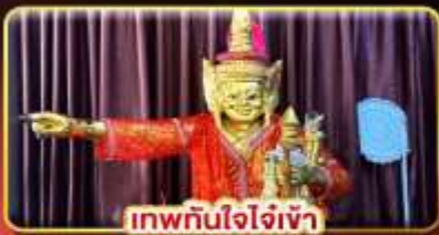
เทพทันใจเจ้า