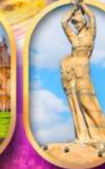
เด็กหญิงชาวประมง