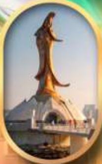
เจ้าแม่กวนอิมริมทะเล