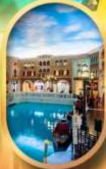
เดอะเวนิเซียน