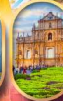
โบสถ์เซนต์พอล