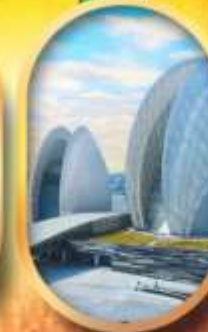
โรงละครไข่มุก