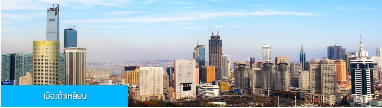
เมืองต้าเหลียน