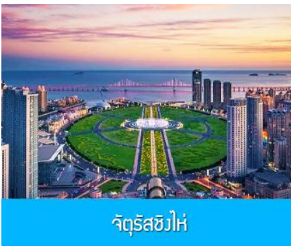
จัตุรัสชิงไห่

เช้า รับประทานอาหารเช้า ณ ห้องอาหารของโรงแรม (1)