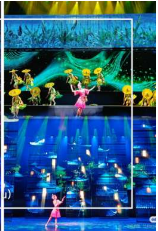
การแสดงโชว์ซีลิ่งคาปู (Xilan Kapu)

เดินทางเข้าโรงแรมที่พัก Xiazhou Hotel ระดับ 4 ดาวหรือเทียบเท่า