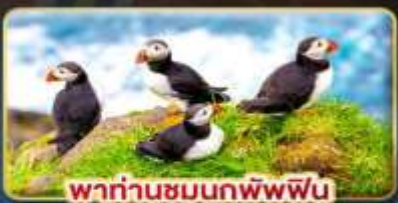
พาท่านชมนกพัฟฟิน