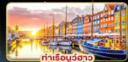
ท่าเรือบูธาว