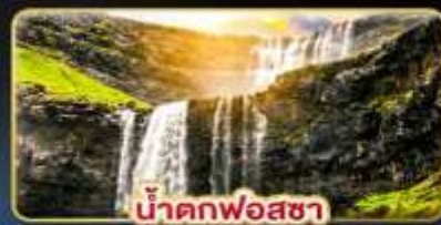
น้ำตกฟอสซา