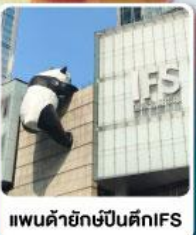
แพนด้ายักษ์ปีนตึกIFS