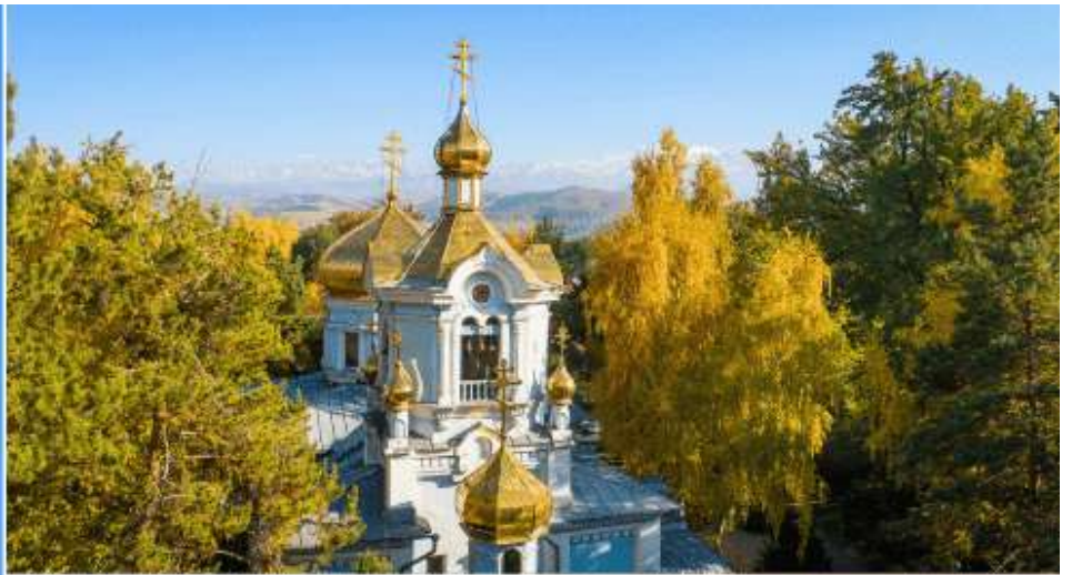
KAZAN ICON OF THE MOTHER OF GOD CATHEDRAL