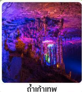
ดำเก้าทพ