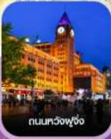
ถนนทงจี่ฟู่จ้ง