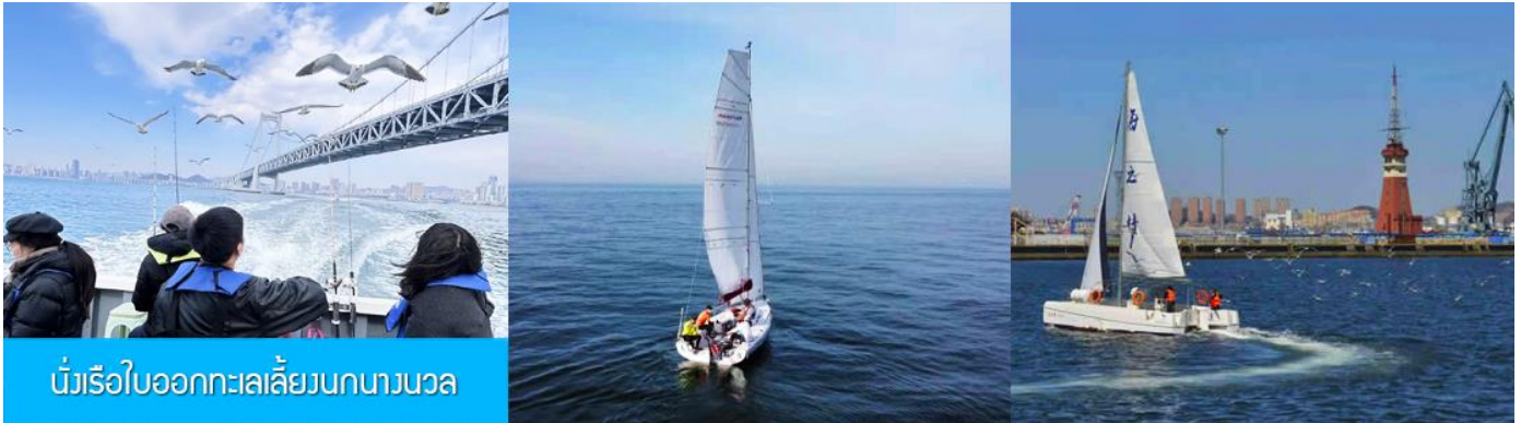
นั่งเรือใบออกทะเลลิ้งนกงางนวล

ไกด์นำเสนอโปรแกรมทัวร์เสริมหรือ OPTIONAL TOUR นั่งเรือใบออกทะเลลิ้งนกงางนวล ชมวิวชายฝั่งเมืองต้าเหลียน ใช้เวลาประมาณ 40 นาที + ขึ้นจุดชมวิวบนเขาดอกบัว (เหลียนฮัวซาน) ชมทัศนียภาพแบบพาโนรามาของเมืองต้าเหลียน + ล่องเรือคอนโดล่าในสวนน้ำเวนิส อัตราค่าบริการท่านละ 500 หยวน หรือ 2,500 บาท อัตรานี้รวมค่าบัตร รถรับส่ง ค่าประกันอุบัติเหตุ และค่าบริการของไกด์ท้องถิ่น