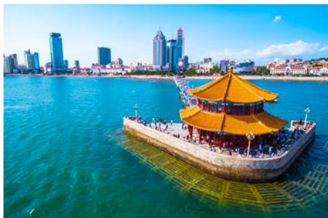
สะพานจ้านเฉียว