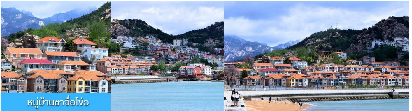
หมู่บ้านชาวโจว

เที่ยง รับประทานอาหารกลางวัน ณ ภัตตาคาร เมนูซีฟู้ด (11)