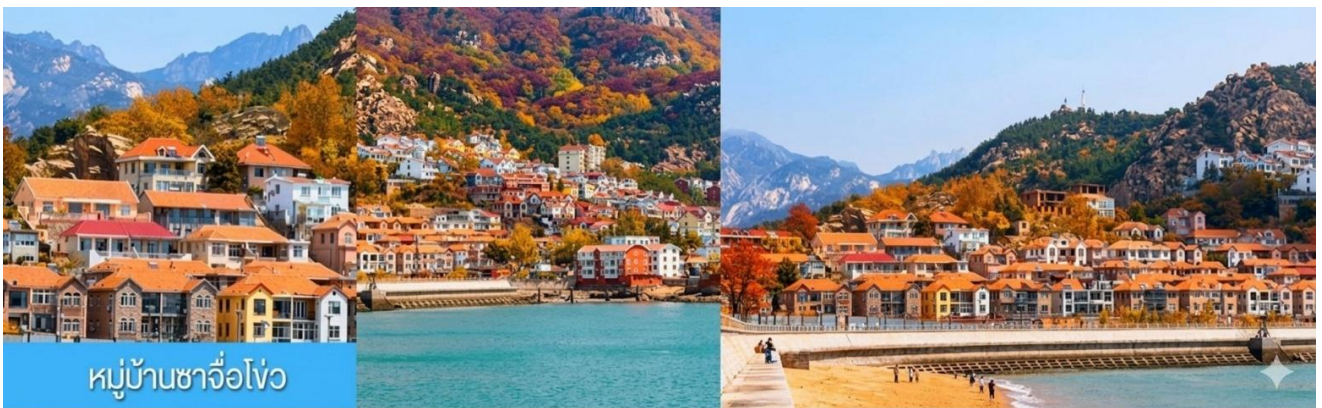
หมู่บ้านซาจื่อโ้ว

พักที่ WEIHAI BOYUE HOTEL / WEIHAI JIANGUO PUYIN โรงแรมระดับ 4 ดาวท้องถิ่นเมืองเว이하ี