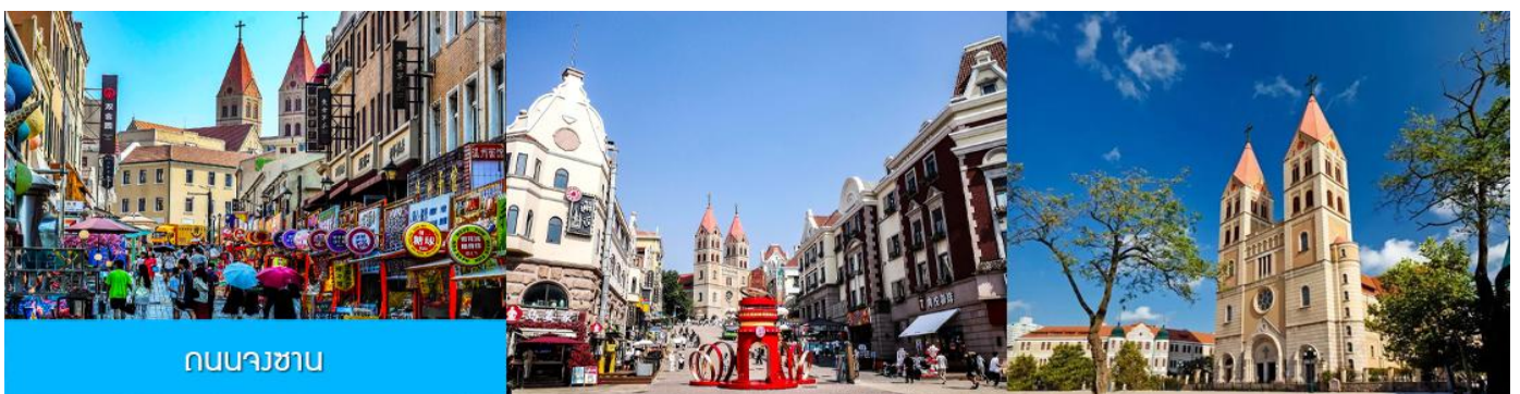
ถนนจงซาน