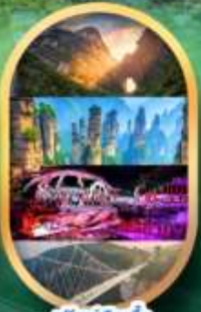
ฟรีคีย์เลือกซื้อ Option เสริม