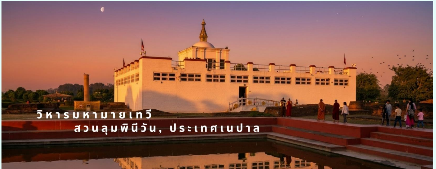
วิหารมหายาเทวี สวนลุมพินีวัน, ประเทศเนปาล

ด้านในวิหารมหายาเทวีไม่อนุญาตให้บันทึกภาพ แต่โดยรอบสวนลุมพินีวัน สามารถถ่ายรูปได้ โดยมีค่าธรรมเนียมกล้องดังนี้ กล้องถ่ายรูปธรรมดา ไม่เสีย กล้องวีดีโอ 10 USD / 800 รูปีอินเดีย / 400 บาท