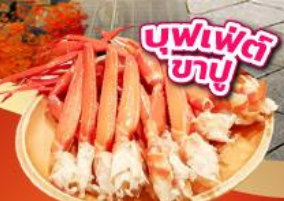
บุฟเฟ่ต์ ซาซู