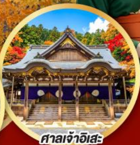
ศาลเจ้าฮิสะ