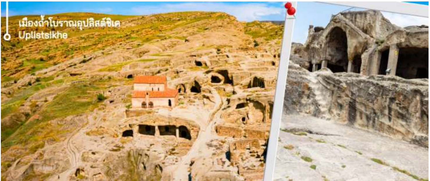
เมืองถ้ำโบราณอูปลิสต์ซิกเค Uplistsikhe

นำท่านเดินทางชมถ้ำโบราณ เมืองถ้ำโบราณอูปลิสต์ซิกเค ได้รับการระบุโดยนักโบราณคดีว่าเป็นหนึ่งในแหล่งที่อยู่อาศัยในเมืองที่เก่าแก่ที่สุดในจอร์เจีย ถ้ำส่วนใหญ่ไม่มีการตกแต่งใดๆ แม้ว่าโครงสร้างขนาดใหญ่บางแห่งจะมีเพดานโค้งแบบอูมังก์ที่แกะสลักหินเลียนแบบท่อนซุง โครงสร้างขนาดใหญ่บางแห่งยังมีช่องเล็กๆ อยู่ด้านหลังหรือด้านข้าง ซึ่งอาจใช้สำหรับพิธีกรรม ด้านหน้าของห้องโถงพิธีกรรมขนาดใหญ่ทางตอนใต้ตกแต่งด้วยซุ้มโค้งแบบโรมันที่มีหน้าจั่ว มหาวิหารในศตวรรษที่ 6 ส่วนใหญ่แกะสลักเข้าไปในหิน ยกเว้นกำแพงด้านใต้ที่สร้างจากหิน ที่จุดสูงสุดของบริเวณนั้นมีมหาวิหาร คริสเตียน ที่สร้างด้วยหินและอิฐในศตวรรษที่ 9-10 การขุดค้นทางโบราณคดีได้ค้นพบสิ่งประดิษฐ์มากมายจากยุคต่างๆ รวมถึงเครื่องประดับทองคำ เงิน และทองสัมฤทธิ์ ตลอดจนตัวอย่างเครื่องปั้นดินเผาและประติมากรรม สิ่งประดิษฐ์เหล่านี้จำนวนมากได้รับการเก็บรักษาไว้ในพิพิธภัณฑ์แห่งชาติในกรุงทบิลีซี