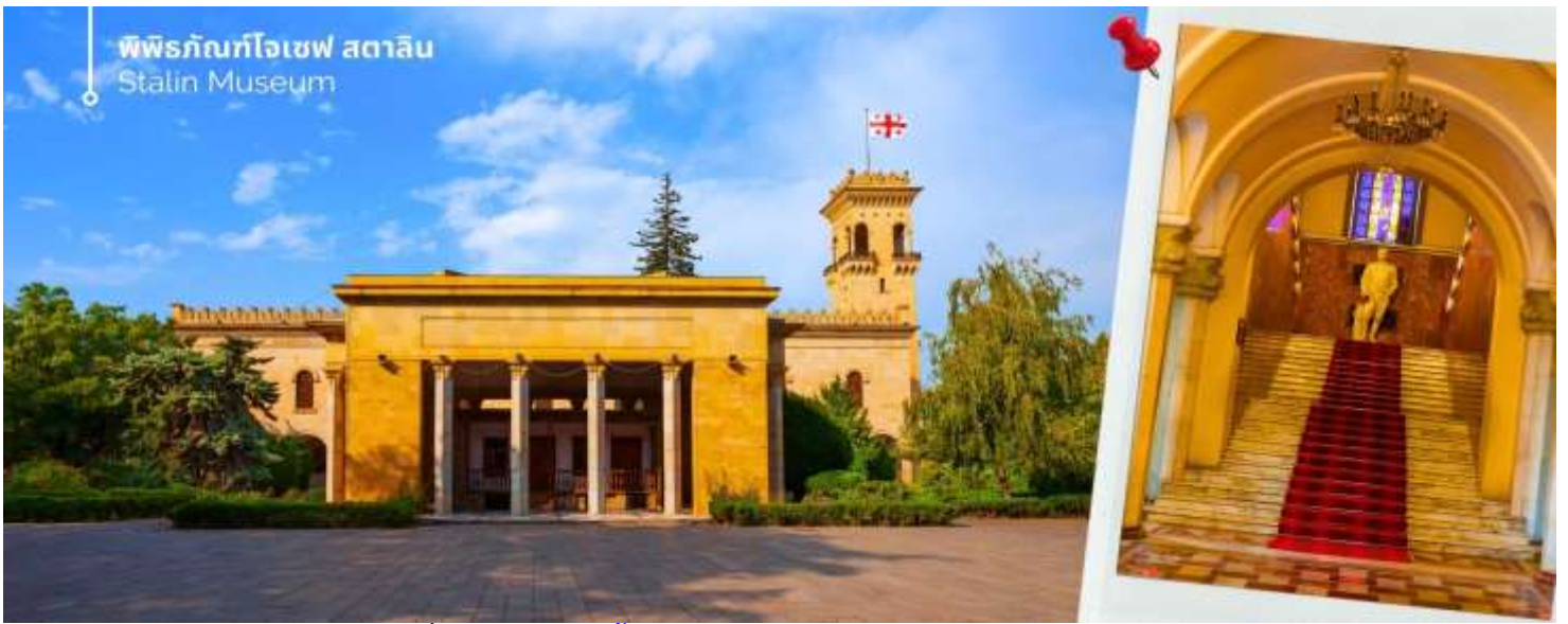
พิพิธภัณฑ์โจเซฟ สตาลิน Stalin Museum

นำท่านเดินทางชมถ้ำโบราณ เมืองถ้ำโบราณอูปลิสต์ซิกเค ได้รับการระบุโดยนักโบราณคดีว่าเป็นหนึ่งในแหล่งที่อยู่อาศัยในเมืองที่เก่าแก่ที่สุดในจอร์เจีย ถ้ำส่วนใหญ่ไม่มีการตกแต่งใดๆ แม้ว่าโครงสร้างขนาดใหญ่บางแห่งจะมีเพดานโค้งแบบอูมังก์ที่แกะสลักหินเลียนแบบท่อนซุง โครงสร้างขนาดใหญ่บางแห่งยังมีช่องเล็กๆ อยู่ด้านหลังหรือด้านข้าง ซึ่งอาจใช้สำหรับพิธีกรรม ด้านหน้าของห้องโถงพิธีกรรมขนาดใหญ่ทางตอนใต้ตกแต่งด้วยซุ้มโค้งแบบโรมันที่มีหน้าจั่ว มหาวิหารในศตวรรษที่ 6 ส่วนใหญ่แกะสลักเข้าไปในหิน ยกเว้นกำแพงด้านใต้ที่สร้างจากหิน ที่จุดสูงสุดของบริเวณนั้นมีมหาวิหาร คริสเตียน ที่สร้างด้วยหินและอิฐในศตวรรษที่ 9-10 การขุดค้นทางโบราณคดีได้ค้นพบสิ่งประดิษฐ์มากมายจากยุคต่างๆ รวมถึงเครื่องประดับทองคำ เงิน และทองสัมฤทธิ์ ตลอดจนตัวอย่างเครื่องปั้นดินเผาและประติมากรรม สิ่งประดิษฐ์เหล่านี้จำนวนมากได้รับการเก็บรักษาไว้ในพิพิธภัณฑ์แห่งชาติในกรุงทบิลีซี